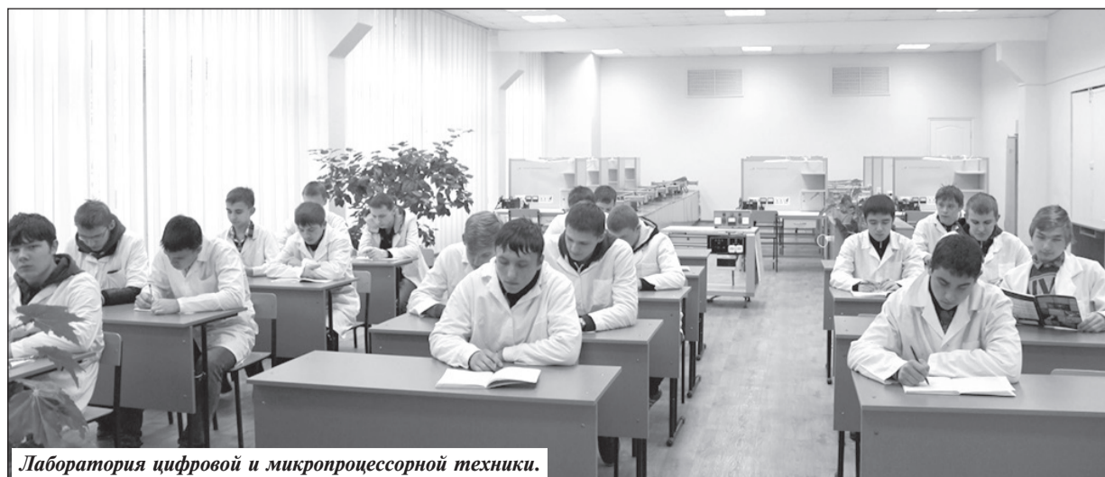
Лаборатория цифровой и микропроцессорной техники.