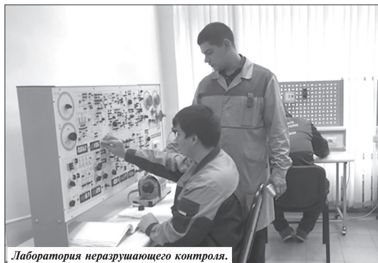
Лаборатория неразрушающего контроля.