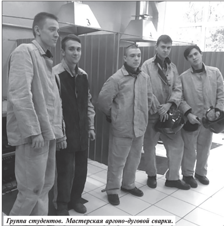
Группа студентов. Мастерская аргоно-дуговой сварки.

Современное производство коренным образом меняет требования к специалистам, которым предстоит в ближайшее время работать на предприятиях. Как откликается на этот вызов система профессионального образования области, свидетельствует пример Брянского техникума энергомашиностроения и радиоэлектроники имени Героя Советского Союза М.А. Афанасьева. Это единственное учебное заведение такого ранга, вошедшее в Федеральную целевую программу развития профессионального образования.